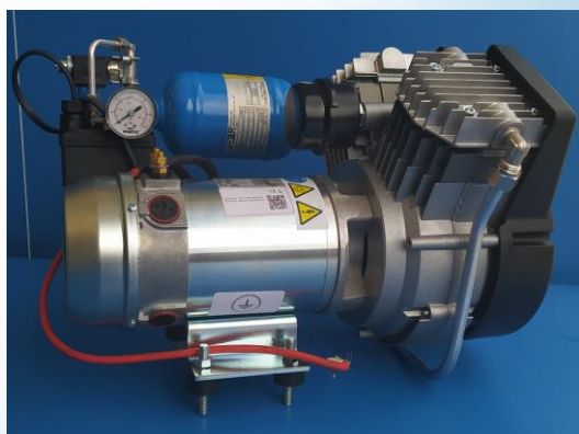
GRU12BCC100VEDIR 45x25xh30 Kg.13